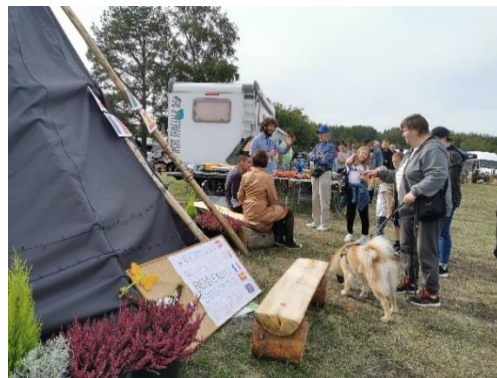
Raahessa vapaaehtoiset olivat monin tavoin mukana luomassa viihtyisämpää elinympäristöä.

Vapaaehtoishankkeiden lisäksi hankkeessa työstettiin myös ensimmäisiä Erasmus+ -nuorisovaihtohankkeita. Keväällä 2019 Espanjan kansallinen toimisto hyväksyi Asociación Juvenil Almenaras -järjestön hakemuksen, jossa Nouseva Rannikkoseutu ry on mukana yhtenä kumppanina. Seitsemän maan yhteinen taideaiheinen nuorisovaihtohanke toteutetaan Malagassa (Espanja) loppuvuoden 2019 aikana. Rahoituksen saaneen hankkeen lisäksi Nouseva Rannikkoseutu ry on MUN KOOVEE -hankkeen aikana ollut kumppanina suunnittelemassa ja hakemassa rahoitusta kansainvälisten kumppanien nuorisovaihtoprojekteissa: